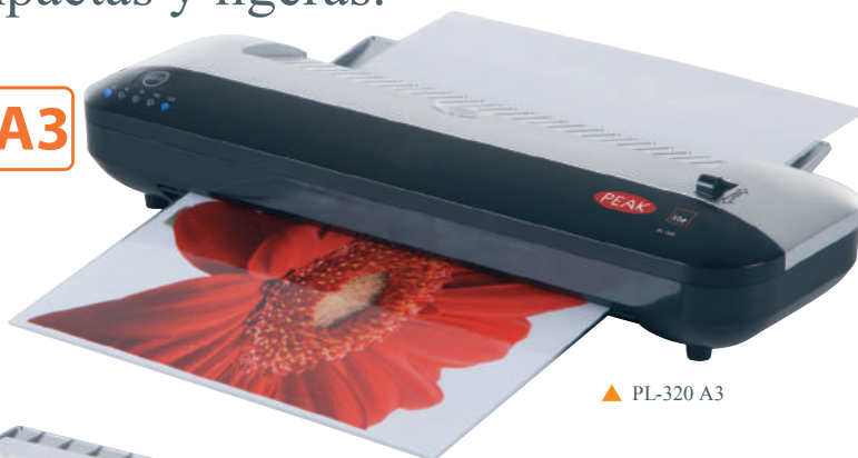
▲ PL-320 A3