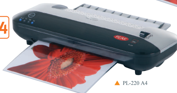
▲ PL-220 A4